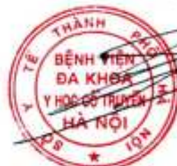
Trần Quốc Hùng